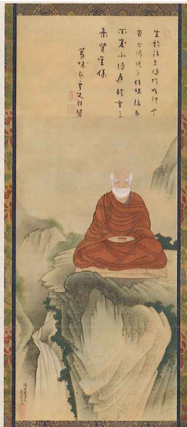
山本義照筆 慈雲巖上坐禅像 (高貴寺所蔵)