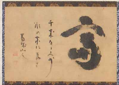
「富」ならびに脇書 (黒川古文化研究所所蔵)